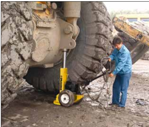
◀ Энерпас Pow'r-Riser® используется в горнодобывающей промышленности для подъема тяжелого оборудования.